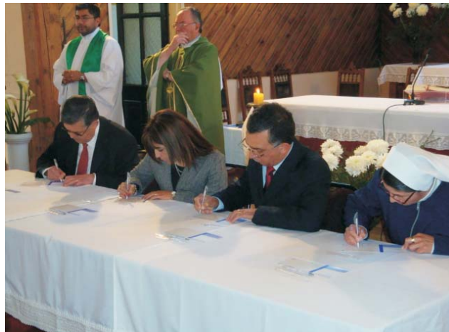
Alcalde y vecinos de la comuna de Puchuncaví, participan en la transcripción del Evangelio de Chile.

Enmarcado dentro de las actividades que ya se han llevado a cabo por motivo del Bicentenario, ocho vecinos de la comuna de Puchuncaví en la Parroquia Nuestra Señora del Rosario, participaron de la transcripción de parte de las Sagradas Escrituras, textos que se unirán a los de otras 7992 personas a lo largo del país y que darán vida al Evangelio de Chile, un regalo de la Iglesia Católica al Pueblo de Chile, para celebrar el Bicentenario.