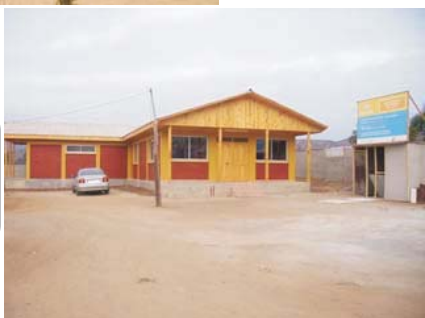
Construcción sede multipropósito Población Don Alfredo, Puchuncaví Monto de inversión $27.608.000