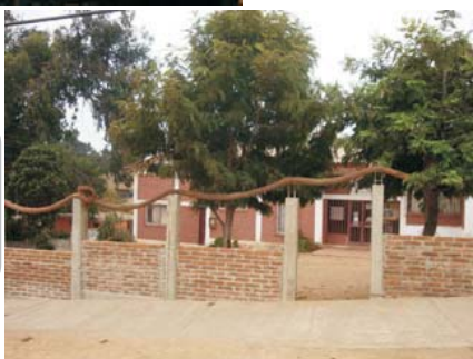
Construcción cierre perimetral, sede sindicato de Pescadores Las Ventanas Monto de inversión $4.986.000